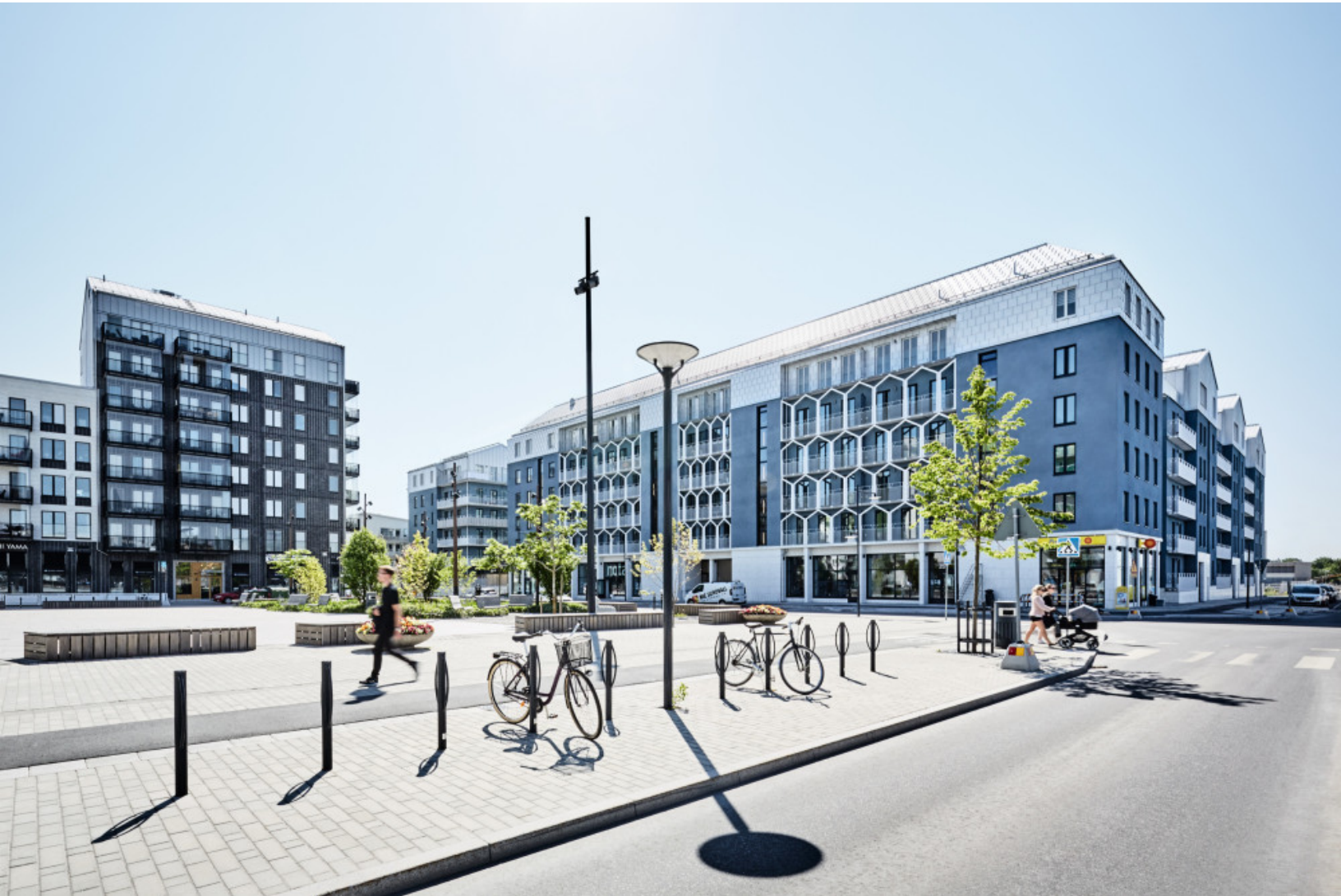
Bild: Paraden, ritad av Kod Arkitekter