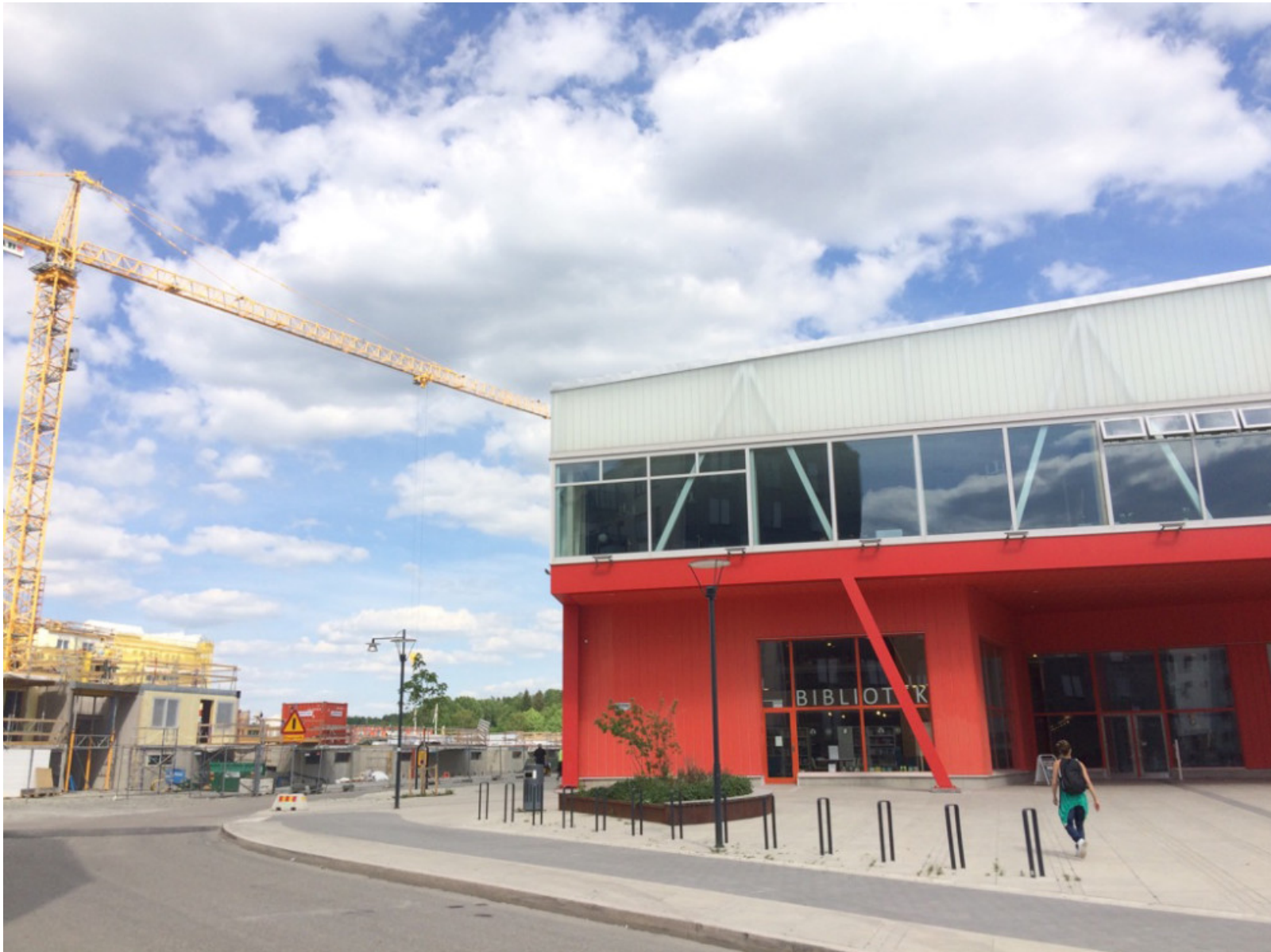
Platsverkstans femte avsnitt spelades in i Biblioteket.