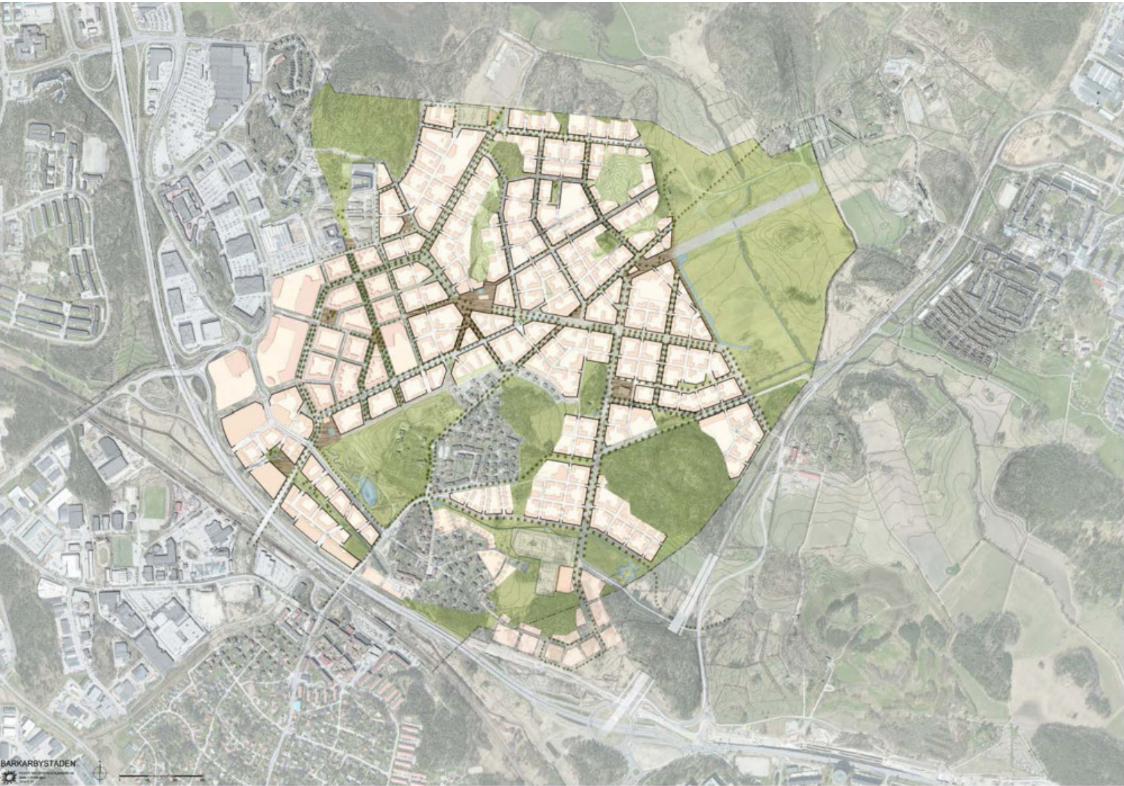
Strukturplan över Barkarbystaden. Järfälla kommun.