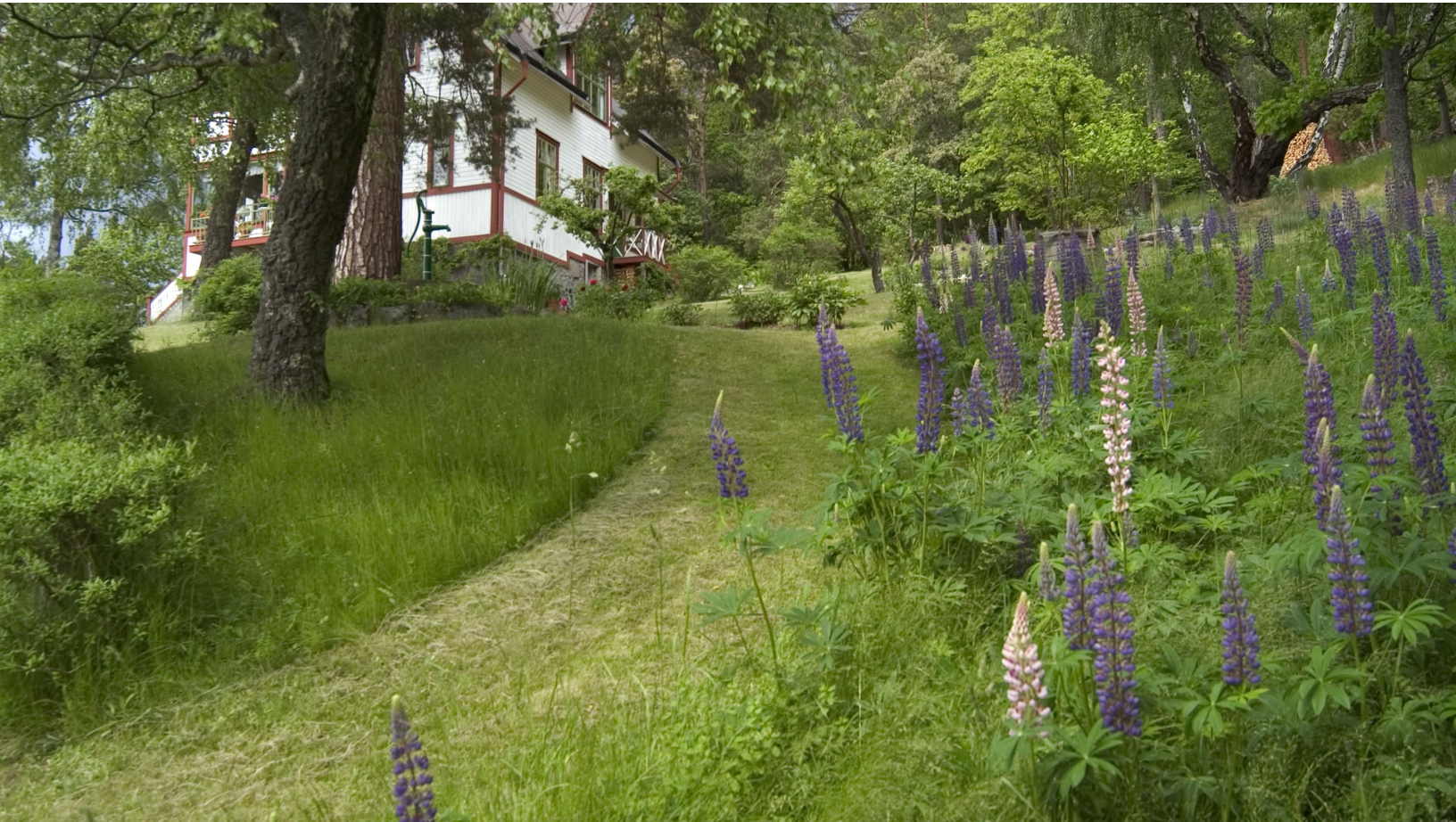
Bildtext: Tynningö. Lupiner i backe upp mot hus.