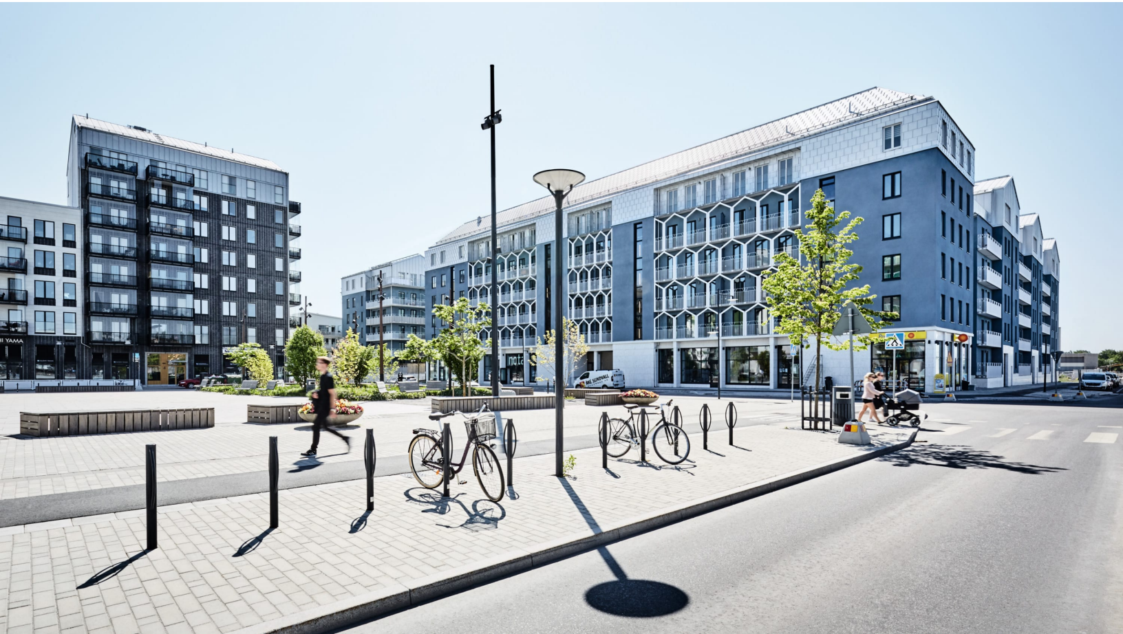
Bild: Paraden, ritad av Kod Arkitekter